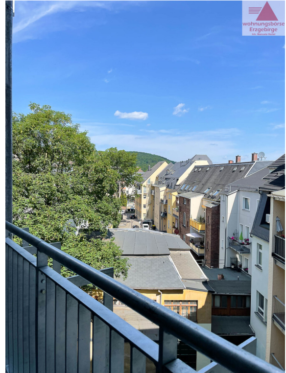
Aussicht von Terrasse