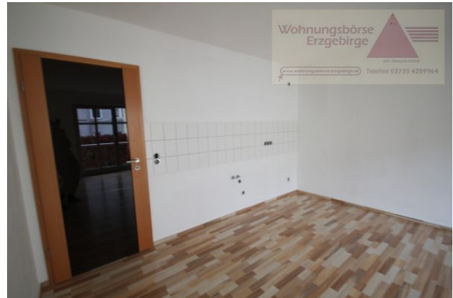
2-Raum-Wohnung mit Balkon, Annaberg-Buchholz