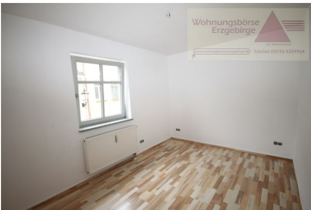
2-Raum-Wohnung mit Balkon, Annaberg-Buchholz