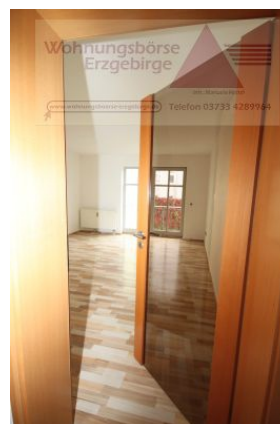
2-Raum-Wohnung mit Balkon, Annaberg-Buchholz