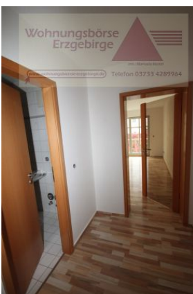
2-Raum-Wohnung mit Balkon, Annaberg-Buchholz