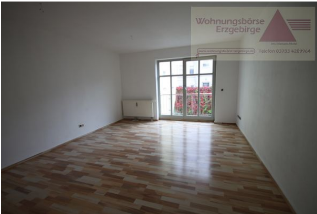
2-Raum-Wohnung mit Balkon, Annaberg-Buchholz