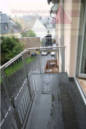
2-Raum-Wohnung mit Balkon, Annaberg-Buchholz