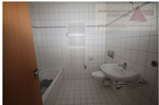
2-Raum-Wohnung mit Balkon, Annaberg-Buchholz