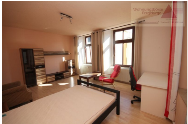
möbl. WG-Zimmer, Annaberg-B.