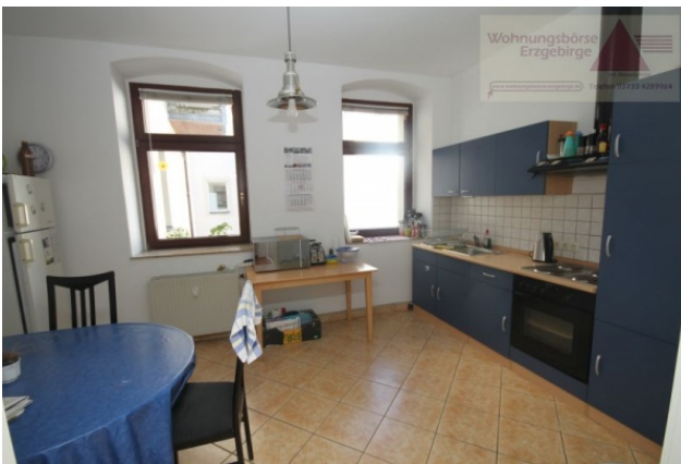
Miet-Objekt 983 Bild017