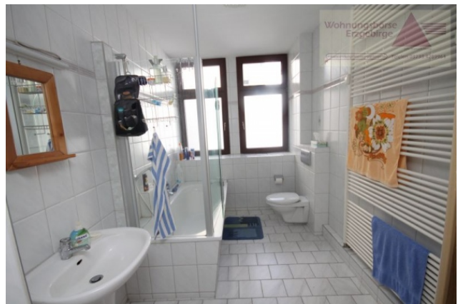
Miet-Objekt 983 Bild018