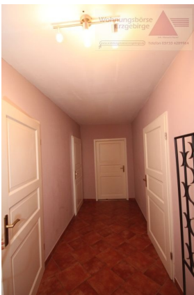
Miet-Objekt 983 Bild021