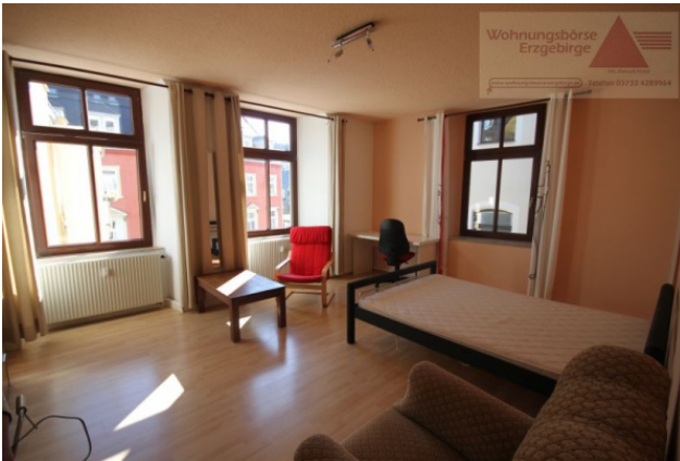
möbl. WG-Zimmer, Annaberg-B.