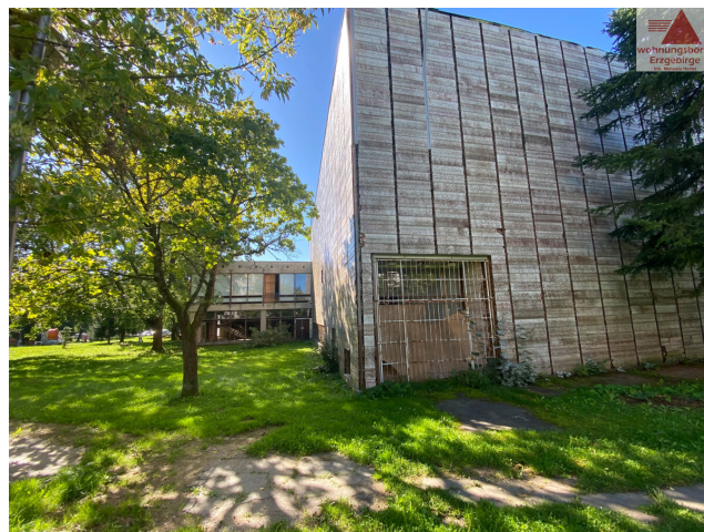
pohled z parkoviště