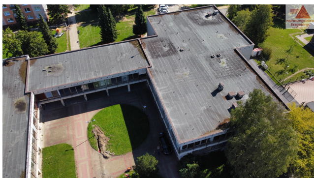
pohled ze vzduchu