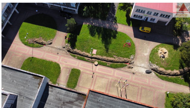
vveřejná plocha, dvůr