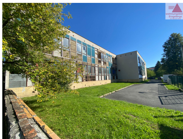
boční pohled ze směru skolky