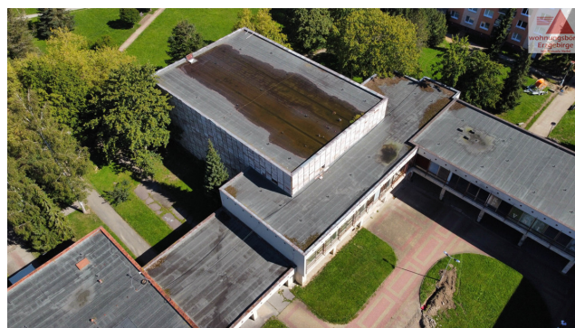
pohled ze vzduchu